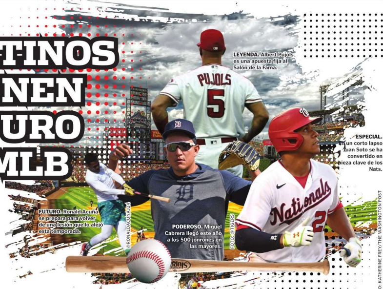
LEYENDA: Albert Pujols es una apuesta fija al Salón de la Fama.

Comparado con Pujols, especialistas lo ponen en el tope del cuarteto de latinos que prometen dar de qué hablar, así como lo hacen ahora, pero con la experiencia de quienes allanaron el camino para verlos crecer.